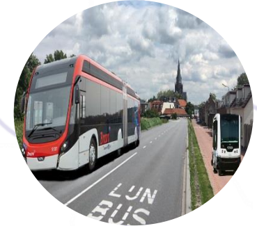
LIJNBUS EN PRT

De mobiliteit in Steenbergen willen wij verbeteren door kleine zelfstandig rijdende busjes (PRT) te introduceren. Deze busjes zullen frequenter gaan rijden daarom is het van belang dat ze energieneutraal zijn en bijvoorbeeld op waterstof rijden. Voor de bereikbaarheid op nationaal niveau zou een hoogwaardig openbaarvervoerlijn tussen Steenbergen en Roosendaal worden gerealiseerd.